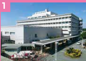
1 沖縄県立北部病院