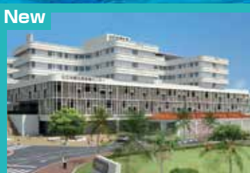
New 公立沖縄北部医療センター