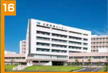
友愛医療センター