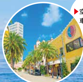
美浜アメリカンビレッジ