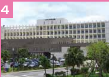
4 沖縄県立宮古病院