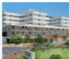
一般財団法人 沖縄県北部医療財団

新病院の周辺には職員宿舎が整備される予定であり、近くにはコンビニエンスストア、ショッピングセンター等があるため、日常生活には困りません。また、北部地域特有のリゾートライフが満喫できるのも魅力です！