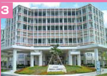
3 沖縄県立南部医療センター・こども医療センター