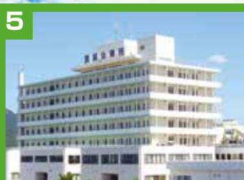
5 北部地区医師会病院