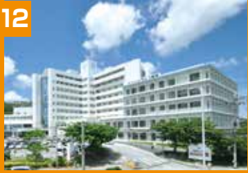
ハートライフ病院