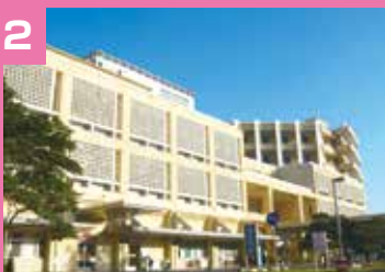
2 沖縄県立中部病院