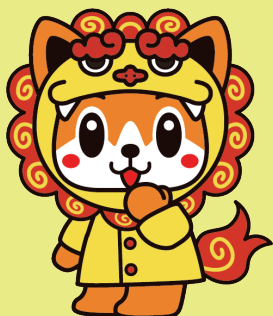
日医新キャラクター 「日医君(にちいくん)」