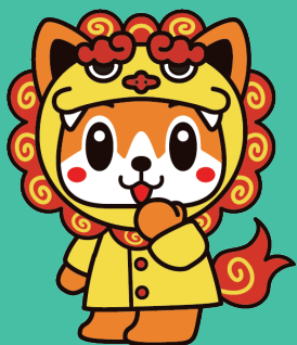
日医新キャラクター 「日医君(にちいくん)」